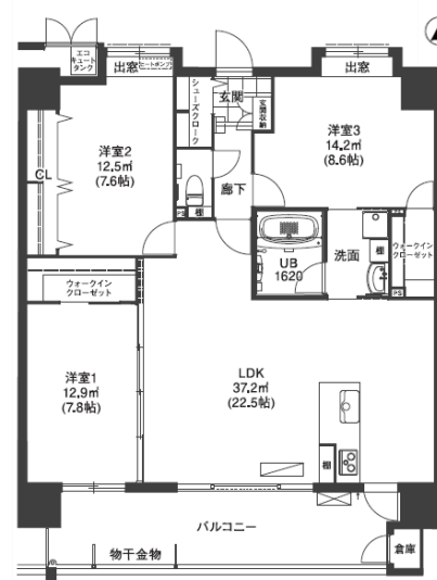
Bタイプ 3LDK 100.61㎡