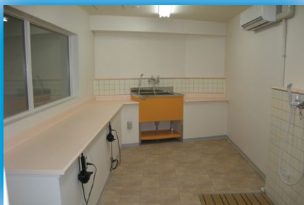
ペット棟には1Fに グルーミングルームを完備