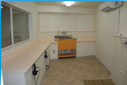
ペット棟には1Fに グルーミングルームを完備