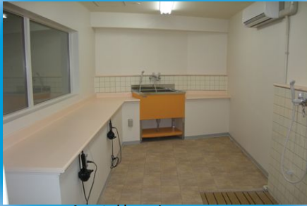
ペット棟には1Fに グルーミングルームを完備